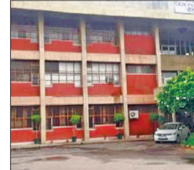
रेवाड़ी। जिला न्यायिक परिसर का फाइल फोटो।