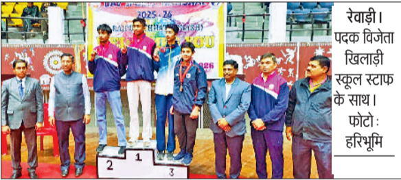
रेवाड़ी। पदक विजेता खिलाड़ी स्कूल स्टाफ के साथ।