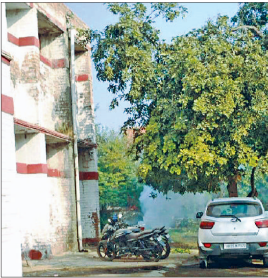
रेवाड़ी। साउथ रेंज साइबर पुलिस स्टेशन।

पुलिस से लेकर बैंकों तक की जागरूकता ठगों के सामने ज्यादा असर नहीं दिखा रही है। नए साल में भी साइबर ठग अपने काम को उसी रफ्तार से अंजाम दे रहे हैं