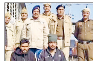
रेवाड़ी। गिरफ्तार किए गए आरोपी जीआरपी की टीम के साथ।

जीआरपी ने शनिवार सुबह रेलवे स्टेशन के प्लेटफॉर्म 8 पर भारी मात्रा में नशीला पदार्थ डोडा पोस्ट के साथ दो आरोपियों को गिरफ्तार किया है। उनके खिलाफ एनडीपीएस एक्ट के तहत केस दर्ज किया गया है। जीआरपी की टीम को प्लेटफॉर्म पर गश्त के दौरान दो युवक सदिग्ध अवस्था में बैठे नजर आए।