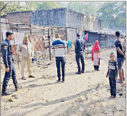
रेवाड़ी। झुगियों और ईट भट्ठों पर लोगों से पूछताछ करते हुए पुलिसकर्मी।