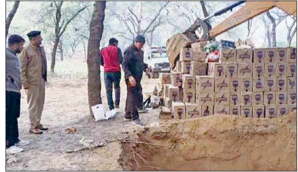
महेंद्रगढ़। शराब नष्ट करती पुलिस।