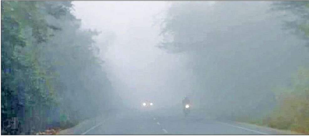
रेवाड़ी। शनिवार को आसमान व सड़कों पर छाया घना कोहरा तथा एक खेत में पकाव की ओर अग्रसर सरसों की फसल।

शनिवार को सुबह के समय घना कोहरा छाया रहा। कुछ स्थानों पर विजिबिलिटी 20 मीटर से भी कम रही। सड़क पर वाहनों की रफ्तार मंद पड़ गई। खासकर दिल्ली-जयपुर नेशनल हाइवे पर फरीदा भरने वाले वाहन रोककर चलते हुए नजर आए। कई परिवारों में जीरो विजिबिलिटी ने वाहन चालकों को जमकर परेशान किया। वाहन चालक एक-दूसरे के पीछे लाइटें जलाकर वाहन चलाते रहे।