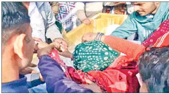
नारनौल। विलाप करते शहीद के परिजन व शहीद की बेटी पिता का शव देखकर फूट-फूटकर रोने लगी।